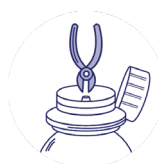
Schritt 2: Schneiden Sie den mittleren Teil des Stopfens so ab, dass eine Öffnung für die Spritze vorhanden ist