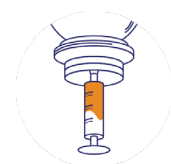
Schritt 3: Ziehen Sie die gewünschte Menge mit der Spritze ab