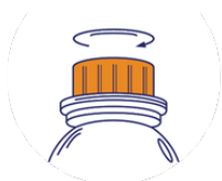
Schritt 1: Öffnen Sie die Flaschenverschluss

Es wird empfohlen, Cavalor Bronchix Pulmo Liq mit einer Spritze direkt in den Mund zu geben.