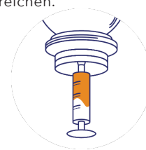
Étape 3 : Mit einer Deckel aufziehen, sodass die gewünschte Menge für die Spritze an der Öffnung vorhanden ist