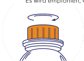
Schritt 1: Kappe öffnen

Es wird empfohlen, Cavalor LaminAid mit einer Spritze direkt ins Pferdemaul zu verabreichen.