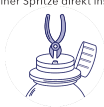
Schritt 2 : Den Mittelteil abschneiden