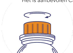
Stap 1: Open de dop

Het is aanbevolen Cavalor LaminAid met een spuit, rechtstreeks in de mond, toe te dienen.