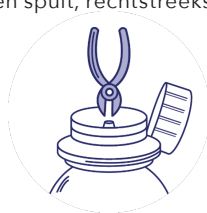
Stap 2: Knip het middelste deel van de plug zodat er een opening is voor de spuit